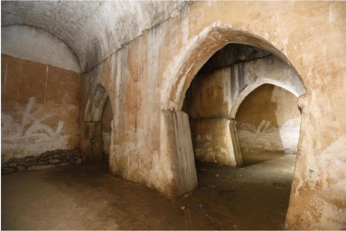
Vista interior de la cisterna