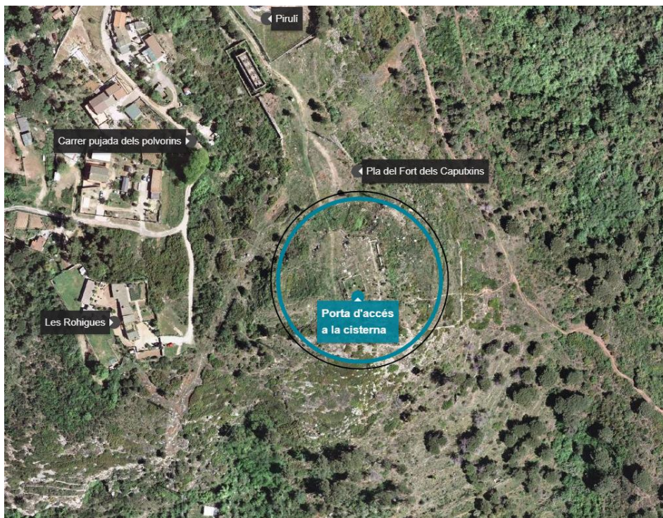
Mapa de situació general